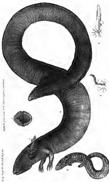
Fig. 5. — Reproduction de la planche IX de l'article d'ET. LUS (1767) sur Siren lucertina (Bibliothèque du Muséum national d'Histoire naturelle, Paris).